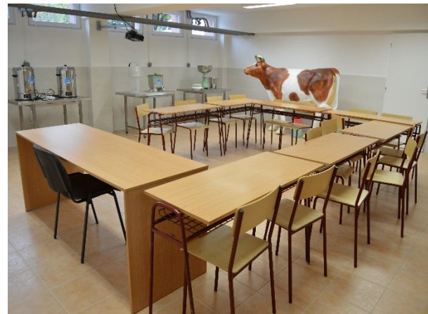
Učebňa potravinárskej technológie