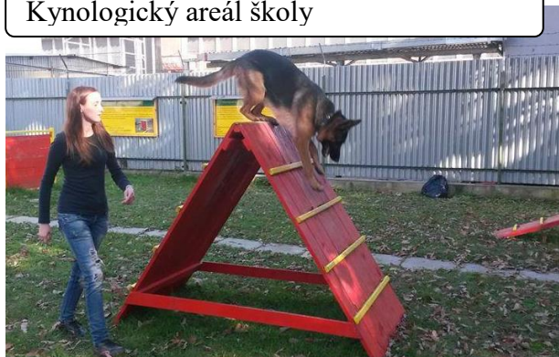
Kynologický areál školy